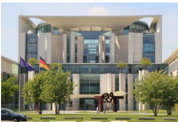
Dr. Anja Weisgerber MdB

CSU setzt sich durch Neues Hilfspaket gegen Corona-Krise